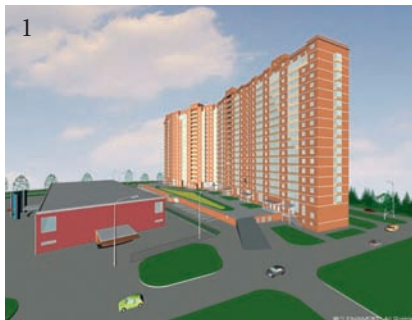
1 [1] МИКРОРАЙОН «БЕРЕЗОВАЯ РОЩА» ПРИМЫКАЕТ К ЦЕНТРАЛЬНОЙ УЛИЦЕ ГОРОДА ВИДНОГО — СОВЕТСКОЙ [2] ДМИТРОВ: ПРИРОДА В ЧЕРТЕ ГОРОДА